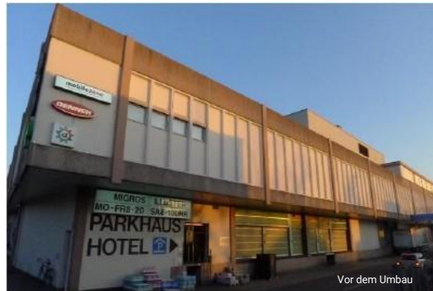
Vor dem Umbau